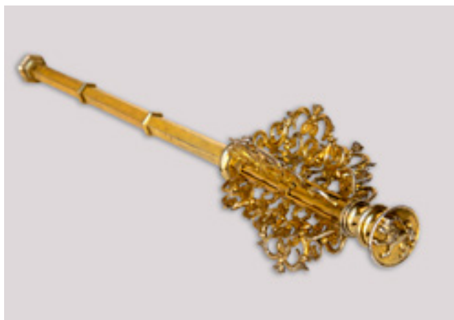
Domingo Estrada Forcada. Maza de ceremonia de la ciudad de Zaragoza, plata sobredorada, principios del siglo XIX (ca. 1803 con intervenciones posteriores). Ayuntamiento de Zaragoza. Centro de Patrimonio Cultural