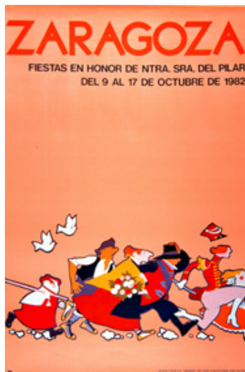
José Luis Cano, Cartel para las Fiestas del Pilar de 1982, lema Vaquilla .