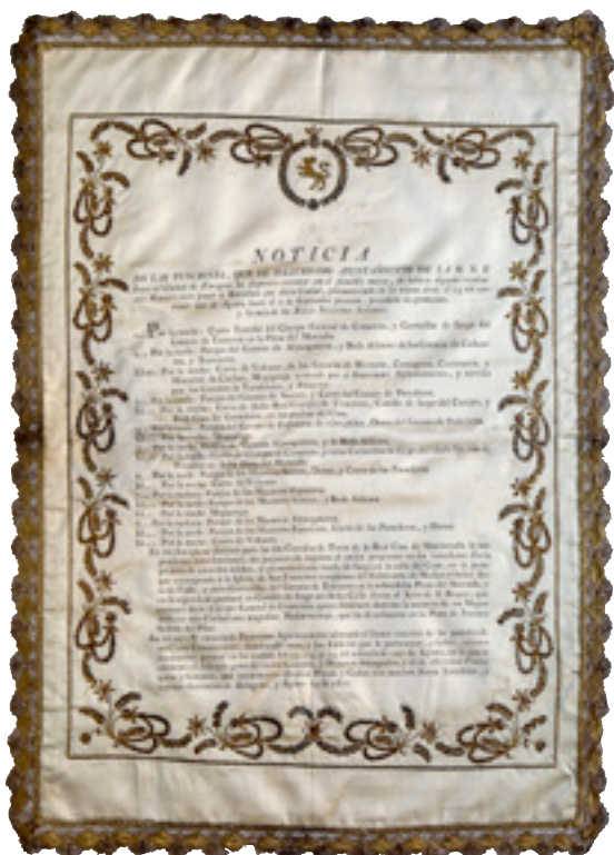
Paño de raso impreso y bordado. José Lizuain, bordador, 1802. Ayuntamiento de Zaragoza. Centro de Patrimonio Cultural