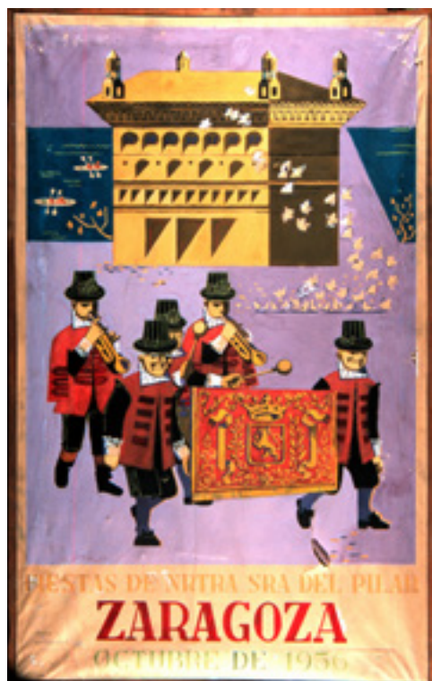
Boceto anónimo presentado al concurso de carteles de 1956 con el lema Continuidad . Archivo Municipal de Zaragoza, CAR0155