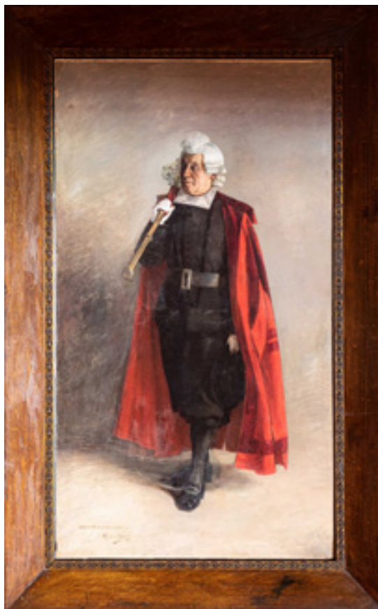
Anselmo Gascón de Gotor, Macero del Ayuntamiento de Zaragoza , 1890, óleo sobre lienzo, 200 x 112 cm. Ayuntamiento de Zaragoza. Centro de Patrimonio Cultural